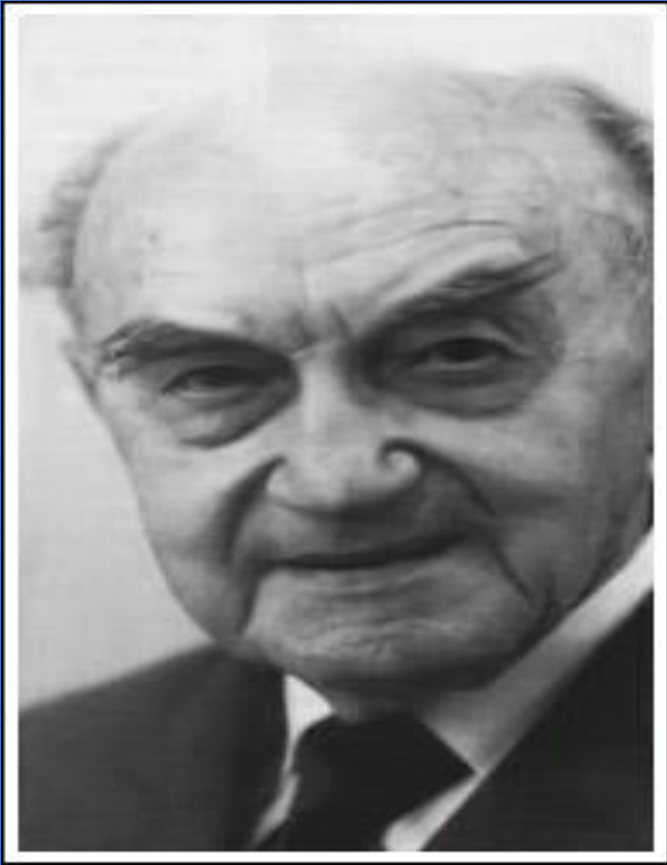
Карл Леонгард (нем. Karl Leonhard ; 21 марта 1904 г., Эдельсфельд, Королевство Бавария— 23 апреля 1988 г., Восточный Берлин, ГДР) — немецкий психиатр. Автор понятия «акцентуированная личность» — одной из первых типологий личностей.

Во второй половине прошлого столетия, в 1968 году, немецкий психиатр К. Леонгард ввел понятие «акцентуация». Он определил ее как отклоняющиеся от нормы чрезмерно усиленные индивидуальные черты личности.