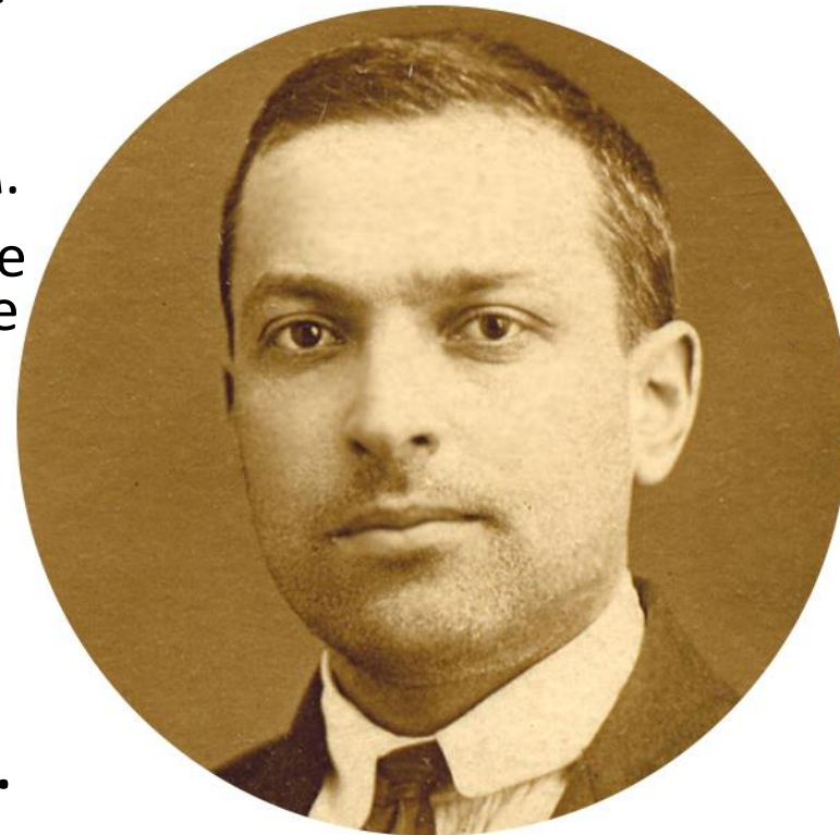
Л. С. Выготский

Возникающая в результате возрастных кризисов более реалистическая жизненная позиция помогает человеку обрести новую относительно стабильную форму взаимоотношений с окружающим миром.