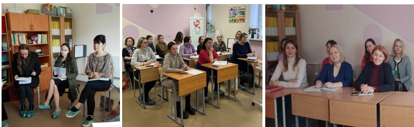
Рис. 8-10. Занятия для специалистов службы сопровождения, начинающих профессиональную деятельность в образовательных организациях района.

Обучение по указанным программам способствует решению задач проекта «Успешный учитель успешного ученика» Программы развития ЦППМСП Красносельского района.