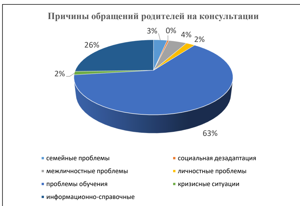
Рис. 13. Причины обращений родителей на индивидуальные консультации к специалистам ЦППМСП Красносельского района

Специалистами ЦППМСП Красносельского района проведено 1476 консультаций для родителей по следующим проблемам: проблемы обучения, семейные проблемы, межличностные и личностные проблемы детей и подростков, кризисные ситуации, социальная дезадаптация, - а также информационно-справочные консультации.