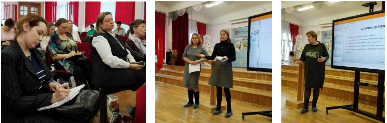
Рис. 3-5. На семинаре-практикуме для классных руководителей «Профилактика кризисных состояний у подростков. Роль и задачи классного руководителя» 1 марта 2023 года.

Для анализа результатов работы районной стажировочной площадки «Просто трудный возраст? - #КЛАССНЫЙТУТОРИАЛ» был проведен опрос участников мероприятий стажировочной площадки.