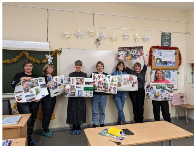
Рис. 15-16. На занятиях группы родителей, обучающихся по программе «Погода в доме». Обучение конструктивному поведению в детско-родительских отношениях с использованием медиативного подхода»

В 2023 году работе с родителями были посвящены мероприятия методического объединения педагогов-психологов: