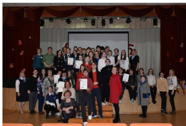
Рис. 17-18. Первый районный Фестиваль Школьных Служб Медиации

14 марта 2023 года проведен районный этап Турнира команд медиаторов-ровесников. В Турнире приняли участие 23 медиатора-ровесника и 10 педагогов (руководители команд, члены жюри): 5 команд из 4 образовательных организаций Красносельского района: