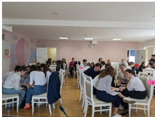
Рис. 19-20. Турнир команд медиаторов-ровесников 2022-23 года

Проект «Организация работы с одаренными детьми» предполагал оказание психолого-педагогической помощи одаренным детям при наличии проблем в эмоционально-волевой, личностной, коммуникативной сфере, реализацию дополнительных общеобразовательных общеразвивающих программ: «Интегративная программа ведения индивидуальной работы с клиентом», «Мой выбор» (для учащихся 8-11-х классов),