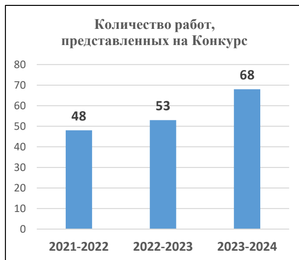
Рис. 12. Количество работ, представленных на Конкурсе цифровых постеров «Твоя психологическая безопасность», по годам проведения Конкурса

Вопросы профилактики суицидального поведения обучающихся обсуждались на мероприятиях методического объединения педагогов-психологов образовательных организаций Красносельского района: