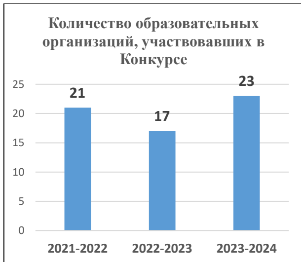
Рис. 11. Количество образовательных организаций, участвовавших в Конкурсе цифровых постеров «Твоя психологическая безопасность», по годам проведения Конкурса

С 1 октября 2023 года по 5 декабря 2023 года проводился районный конкурс цифровых постеров (мини-плакатов, флаеров) «Твоя психологическая безопасность». В 2023 году конкурс проводился в третий раз, что дает основание считать его традиционным для образовательной системы Красносельского района. Целью конкурса явилось создание условий для формирования безопасной школьной среды и профилактика физического, психологического насилия в его различных проявлениях в образовательных организациях Красносельского района. В конкурсе принимали участие учащиеся 23 образовательных организаций. Работы представили 77 обучающихся. Всего были представлены 68 работ.