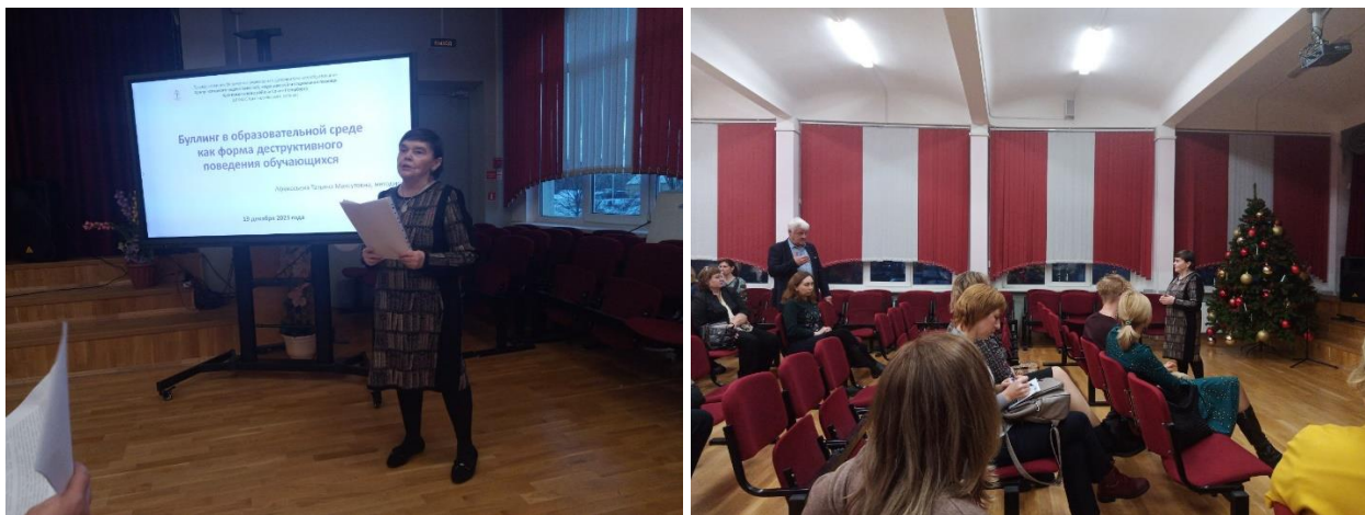
Рис. 6-7. На методическом семинаре для классных руководителей образовательных организаций «Профилактика деструктивного поведения обучающихся» 19 декабря 2023 года.

19 декабря 2023 года состоялся методический семинар для классных руководителей образовательных организаций «Профилактика деструктивного поведения обучающихся». На семинаре были рассмотрены вопросы профилактики негативных проявлений в коллективах обучающихся и оказанию помощи обучающимся по итогам социально-психологического тестирования.