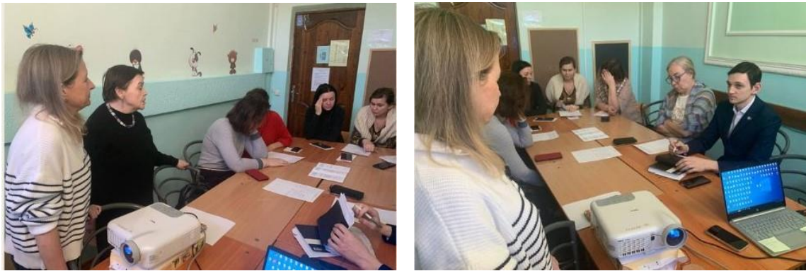
Рис. 1-2. Практикумы для классных руководителей образовательных организаций района «Признаки суицидального поведения детей и подростков» 14 и 21 февраля 2023 года.